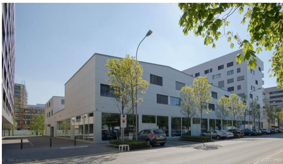
© Bilder Urheberrechtlich geschützt