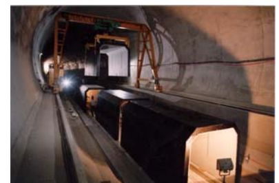
Montage im Habsburgtunnel