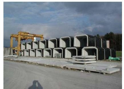
Elemente auf dem Lagerplatz