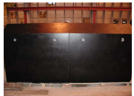
Probemontage im Werk