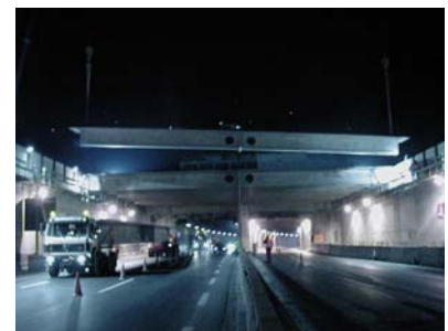
Absenken über Auflager