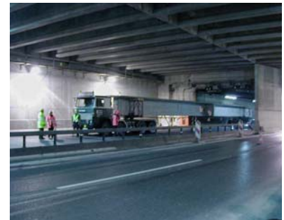
Einfahrt eines Trägers Just-in-Time