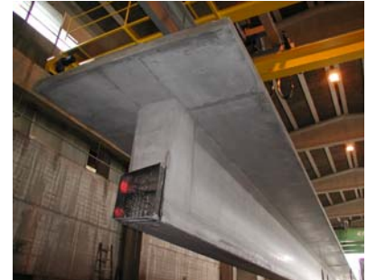
Frisch ausgeschalter Träger im Werk