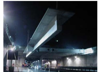
Mit 2 Pneuکرanen angehoben und bereit zum Schwenken